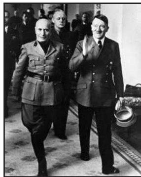
Imagen de la reunión en Salzburgo entre Hitler y Mussolini.

El nacionalsocialismo fue vivido por sus seguidores como un verdadero dogma de fe. No había margen para cuestionamiento alguno sobre sus bases e ideología.