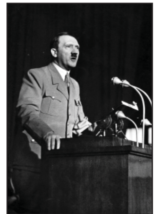
Adolf Hitler dando un discurso en Ludwigshafen.

Además, se profundiza en la figura de sus colaboradores: Goering, Goebbels, Himmler, Ribbentrop, Röhm etc.