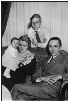
Paul Joseph Goebbels, con su mujer Magda y dos de sus hijos.

Hitler consiguió enamorar a Goebbels , hasta tal punto que el responsable de propaganda llegó a afirmar que le quería por ser grande y sencillo al mismo tiempo. El carisma hitleriano caló de lleno en él, que siempre se caracterizó por su vanidad. A pesar de que Hitler no llegó a incluirle en su núcleo más íntimo, siempre le mantuvo a su lado y fue una de las figuras más relevantes del nacionalsocialismo.