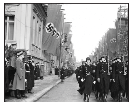
Destacamento especial Leibstandarte SS, dirigido por Sepp Dietrich.